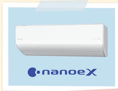
エアコン Eolia (2023年度モデル LXシリーズ) 2022年度 省エネ大賞受賞

少ない水できれいに洗浄できるだけでなく、スゴピカ素材(有機ガラス系)でおそうじもラクラク♡