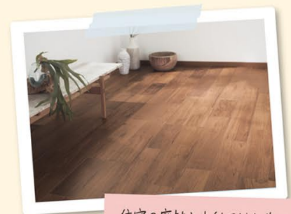
環境配慮型 木質床材 サステナブル 7フロア™

ナノイーXでお部屋の空気が清潔に。排熱を浴房・暖房に有効活用。切り忘れ通知や電気代もアプリでわかるのね。