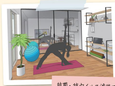
ハリテイスフロアーW 直貼タイプ 45 耐熱

「じゃあ、空いてる部屋をリフォームして、器具も一緒に使おうよ」と主人。なるほど、きれいなトレーニングルームで、2人で気分を上げていくのね。それなら、今度こそ、続くかも♡