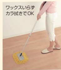
ワックスいらす カラ拭きでOK

抗菌・抗ウイルス塗装で、お掃除もラクな床材だから、たっぷり汗をかいても平気。傷にも強いから、器具を置いてしっかり運動できる。防音効果もうれしい。トレーニングルームにピッタリね。