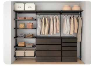
ウェアからグッズまで 収納をカスタマイズ モチベーションUPにはウェアも重要。お気に入りの飾るも、大切に仕舞うも、「アイセルフ」なら自由自在。