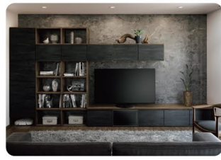
TVまわりの壁面を活用して グッズをすっきり収納 散らかりがちなグッズを、「キューピオス」ですっきり収納。憧れの人の写真も飾れ、映像を観ながら楽しく運動!