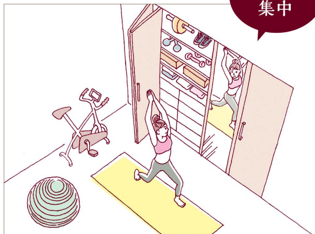
空き部屋を専用ルームにすれば、道具を毎回片付けなくてもよくなり、家族に気兼ねせず思う存分「宅トレ」ができます。