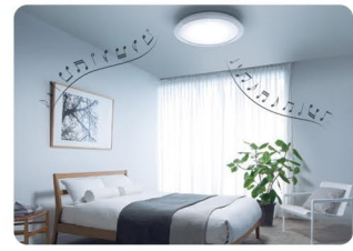
スピーカー付きライトで 気分をアップ スピーカー付き照明なら、好きな曲が天井から降り注ぎ、モチベーションもアップ。ダンスの練習にも!