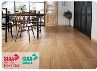
傷つきにくく、 抗菌・抗ウイルスで清潔に 「アーキスベック」なら、擦り傷や汚れに強く、グッズを使った運動も気兼ねなく。衛生的に保つ塗装も!