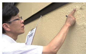
専用器具等を使って、綿密に診断します。