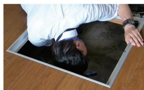
点検しにくい床下や小屋根、水廻りもチェック。